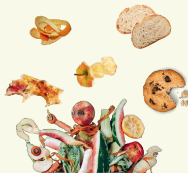
Epluchures et restes de repas