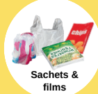
Sachets & films

Il faut simplement les vider et les déposer séparés les uns des autres.