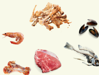
Reste de viandes poissons et crustacé