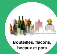
Bouteilles, flacons, bocaux et pots