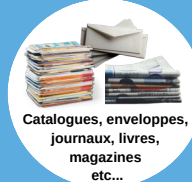
Catalogues, enveloppes, journaux, livres, magazines etc...