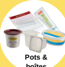
Pots & boîtes