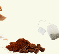
Marc de café et thé